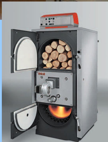
vegyes tüzelésű kazán