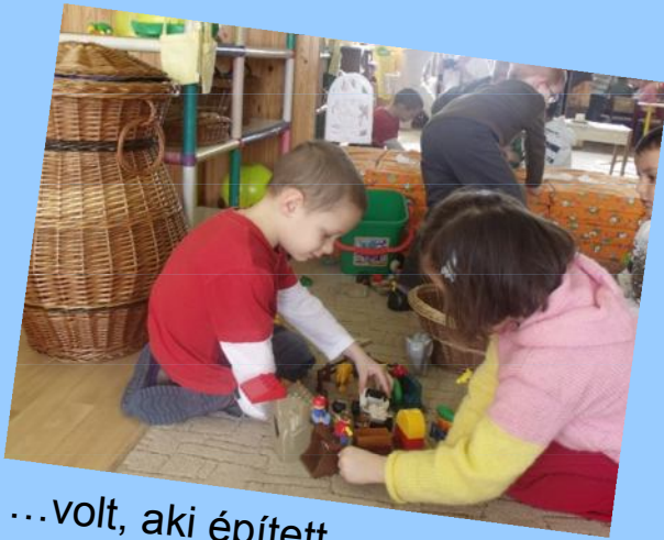
...volt, aki épített, ...