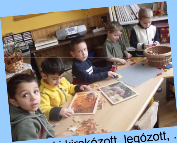
Volt, aki kirakózott, legózott, ...