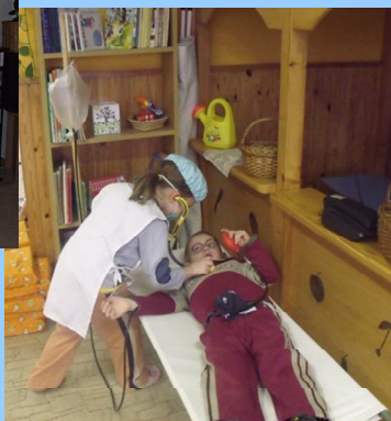
Betegség - egészség