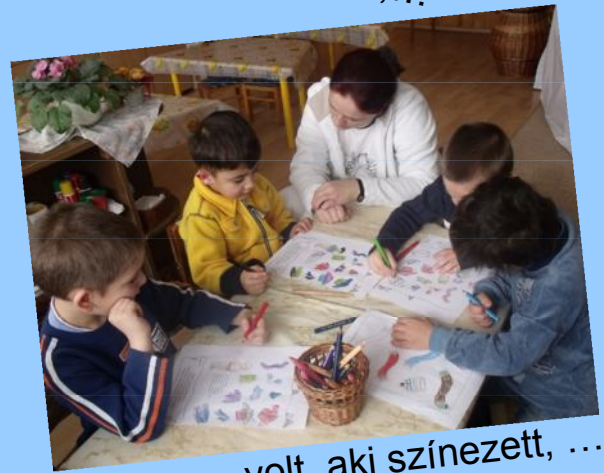
... volt, aki színezt, ...

... és voltak, akik a technika újdonságait választották!