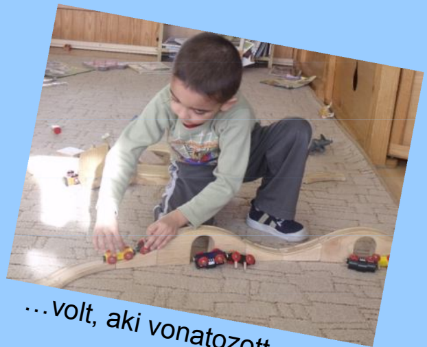
...volt, aki vonatozott,...