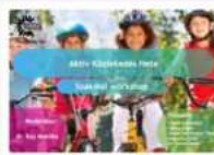
Aktív Közlekedés Hete (2024/2025. tanév)