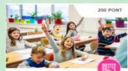
Aktív (mozgásos) tanulás