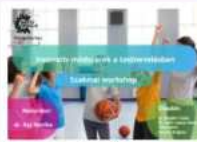
Innovatív módszerek a testnevelésben (2024/2025. tanév)