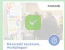
Részvétel képzésen, workshopon