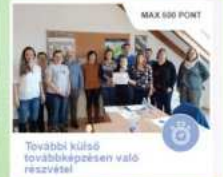
További külső továbbképesítésre való részvétel