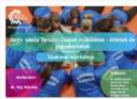
Tanulói Csoport működése (2024/2025. tanév)