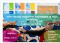
Aktív tanulási módszerek alkalmazása (2024/2025. tanév)