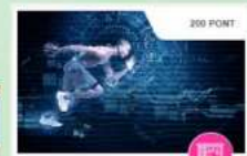
Digitális, mozgásra ösztönző eszközök használata