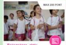
Egészséges, aktív életmód (kampányesemény-részvétel)