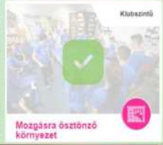
Mozgásra ösztönző környezet